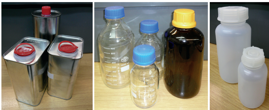
Abbildung 4: Geeignete Gefässe für FAME-Rückstellmuster

Als Behälter für Rückstellmuster eignen sich Weissblechkanister mit Einpressdeckel, Edelstahl- oder Glasgefässe. Für analytische Untersuchungen ohne längere Lagerungszeiten erfüllen auch Polyethylen- oder Polypropylen-Gefässe die Anforderungen (siehe Tabelle 5 und Abbildung 4). Andere als die in der Tabelle genannten Behälter / Gefässe sollten nicht verwendet werden (z.B. PVC-Behälter).