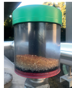
Abbildung 3: Beispiel eines Luftentfeuchtungsfilters

Empfehlung: Regelmässig Sichtkontrollen auf Kondenswasser im Tank durchführen. Es bieten sich zudem Vorkehrungen an, welche die Wasseraufnahme durch die tägliche Atmung des Tanks reduzieren (siehe Abbildung 3).